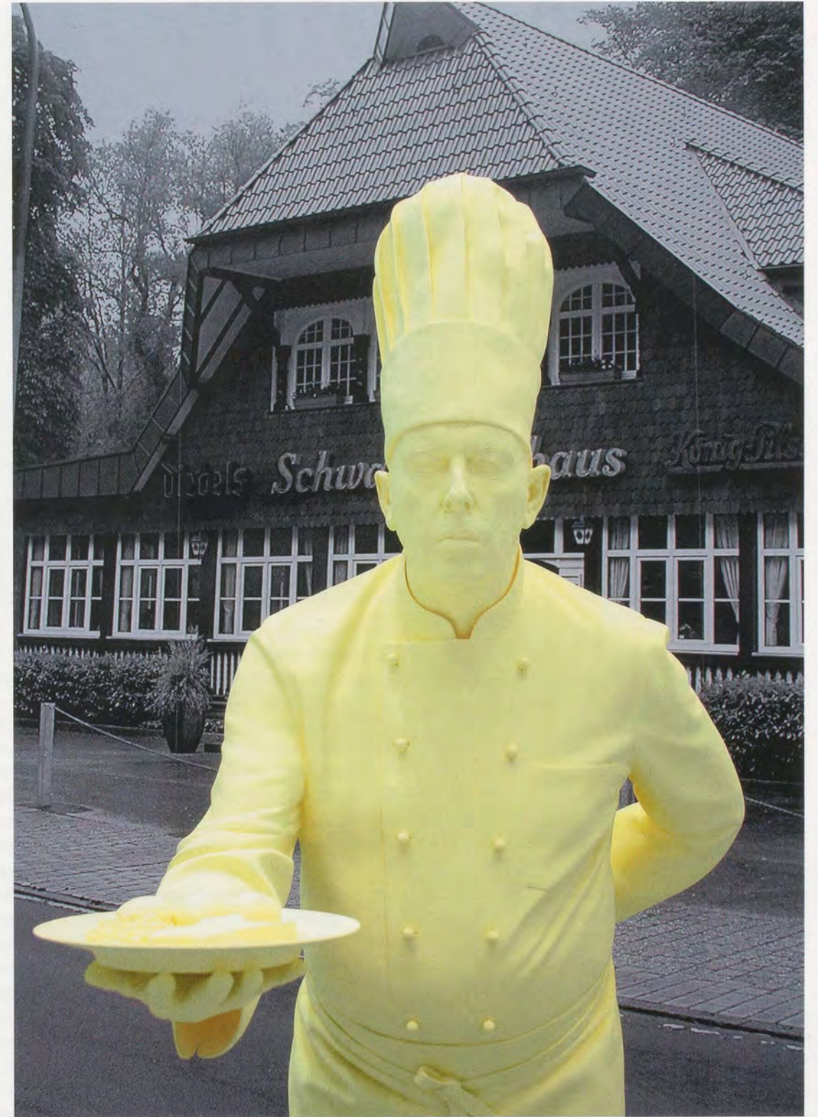
KATHARINA FRITSCH, COOK, 2008, polyester, color, 79 1/2 x 30 x 40 1/8"; PHOTOGRAPH 6 (BLACK FOREST HOUSE), 2006/2008, silkscreen, plastic, paint, 110 1/4 x 147 3/4"; detail / KOCH, Polyester, Farbe, 202 x 76 x 102 cm; 6. FOTO (SCHWARZWALDHAUS), Siebdruck, Kunststoff, Farbe, 280 x 375 cm, Detail.

While I am familiar with the sources from which many of Fritsch’s representations are thought to be derived, I have never been entirely convinced by the psychoanalytic reading of her work. Perhaps I am separated from the work by a generational, or even a national, sort of schism; I do feel quite far removed from any underlying phobias derived from devils, rats, and religious fables. In the urban London of my childhood, the real threats were burglars, muggers, and random street violence. When I look at Fritsch’s RATTENKÖNIG (Rat-King, 1991–93), DOKTOR (1999), or HÄNDLER (Dealer, 2001), my overwhelming impression is of the otherworldly and even hallucinogenic effect of her immaculately modeled, matte surfaces. Their extraordinary autonomy from their surroundings strikes me as ultra-contemporary: rather than appearing like refugees from a recreation of a dance macabre or a German medieval fable, their true home seems closer to commercialized popular culture and to the disarming visual ef-