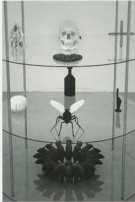
KATHARINA FRITSCH, DISPLAY STAND II, 2001, glass, aluminum, and objects dating from 1981 – 2001, detail / WARENGESTELL II, Glas, Aluminium, Objekte, Detail.

Much has been said of the unconscious in the work of Katharina Fritsch. It has been described as “sinister and uncanny” 1) and said to deal with “the dark side of the psyche.” 2) From her early representations of rats, a monk, and a ghost, to her recent sculptures of a giant, a snake, and an octopus, the ur-myths and fables supposedly summoned by these forms have generally been thought to lead us unwittingly to assess their—and our own—greater psychological depths. Fritsch’s technique is to amplify; her manifestly scrupulous attention to detail, scale, color, and surface allows not only for the immediate comprehensibility of form, but provides one with the sensation of enduring a visitation to the site of a formative experience.