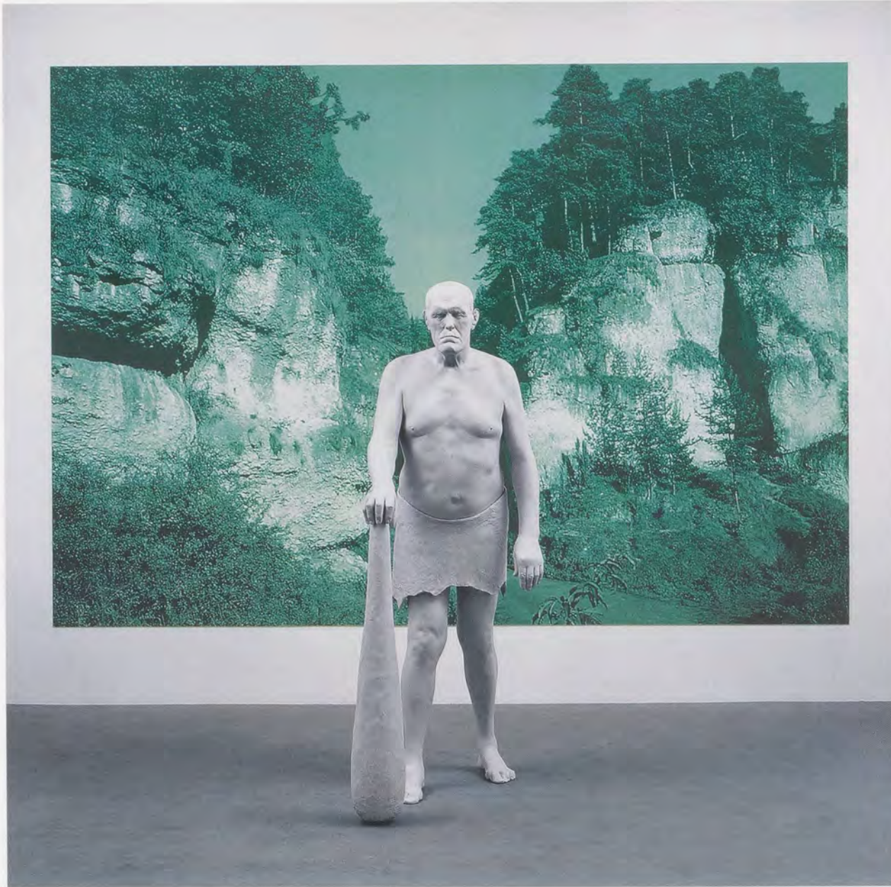
KATHARINA FRITSCH, GIANT, 2008, polyester, paint, 76 3/4 x 37 4/8 x 27 1/2"; POSTCARD 4 (FRANCONIA), 2008, silkscreen, plastic, paint, 110 1/4 x 159 1/2" / RIESE, Polyester, Farbe, 195 x 95 x 70 cm; 4. POSTKARTE (FRANKEN), Siebdruck, Kunststoff, Farbe, 280 x 405 cm.

bin ich zunächst einmal von der überirdischen, ja geradezu halluzinatorischen Wirkung der makellos modellierten, matten Oberflächen überwältigt. Die aussergewöhnliche Autonomie dieser Werke im Verhältnis zur ihrer Umgebung halte ich für ultrazeitgenössisch: Sie scheinen mir in Wahrheit eher in der verkommerzialiserten Volkskultur und den entwaffnenden Bildeffekten des Films beheimatet, als aus einem wiedererstandenen Totentanz oder einer Fabel des deutschen Mittelalters entsprungen zu sein. So wie Fritschs Werke der kontextuellen Einbettung in den Ausstellungsraum widerstehen, wirken sie sogar beinahe wie eine Art digitale Projektion. Diese entwaffnende Qualität geht auch auf die dezidiert nicht spiegelnden Oberflächen zurück, die jede Absorption der Umgebung verunmöglichen, genau wie ihr makelloser Finish sie vom Betrachter und jedem nichtfritschschen Werk abhebt, das das Pech hat, in ihren Dunstkreis zu geraten. Dennoch liegt die verunsichernde, geisterhafte Qualität von Fritschs Arbeiten eindeutig in ihrer unerbittlichen räumlichen Existenz; sie bleiben für uns – anders als ein Film, in den wir eintauchen können – undurchdringlich. Diese Wesen erwecken nicht den Eindruck von Trugbildern aus einer Hollywoodwerkstatt, sondern es handelt sich ganz klar um einzigartige skulpturale Objekte, die sich offensichtlich nicht in ihre Umgebung einfügen wollen.