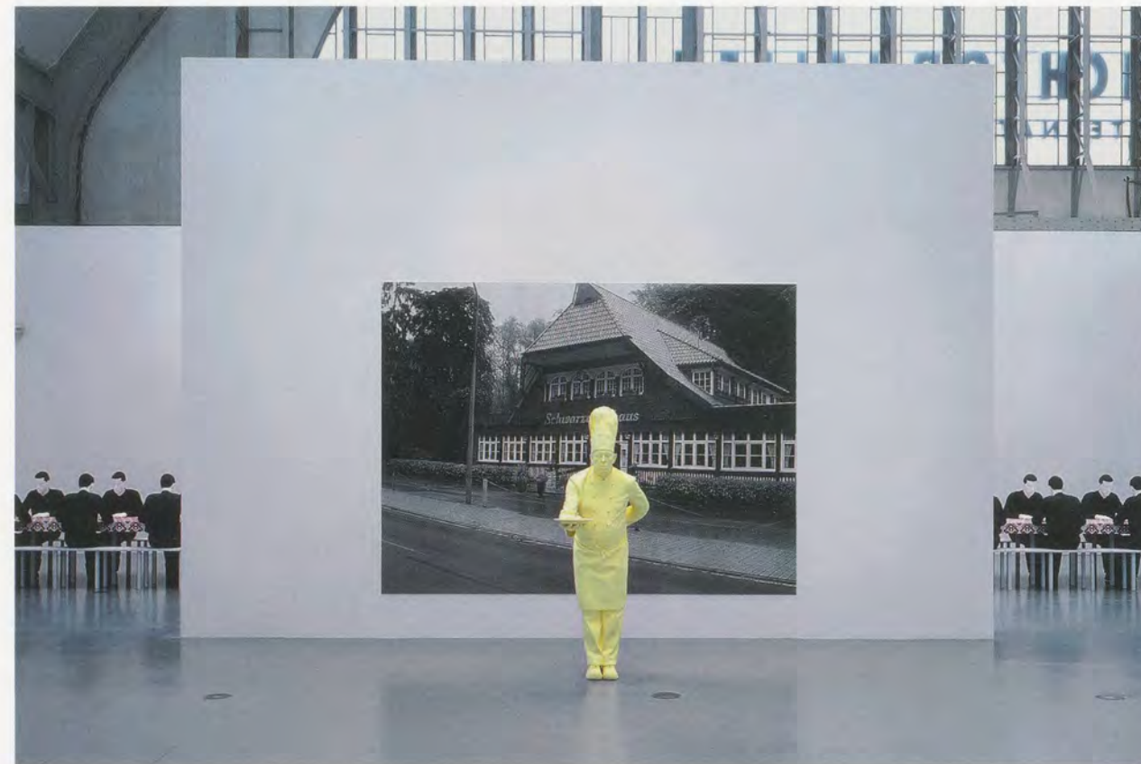
KATHARINA FRITSCH, COOK, 2008; PHOTOGRAPH 6 (BLACK FOREST HOUSE), 2006/2008; COMPANY AT TABLE, 1988, exhibition view, Deichtorhallen, Hamburg / KOCH, 6. FOTO (SCHWARZWALDHAUS), TISCHGESELLSCHAFT, Ausstellungsansicht.

fects of film. Indeed, the manner in which Fritsch's work resists contextualization in the gallery further suggests some form of digitized projection. This disarming quality is also a result of their resolutely non-reflective surfaces that disallow for any absorption of the surroundings, as well as their pristine finish that sets them apart from the viewer and from any non-Fritsch artworks unfortunate enough to be in their proximity. And yet, the unnerving, apparitional quality of Fritsch's work is distinctly its obdurate existence in space; our relationship to it, unlike cinema's immersion, remains one of impenetrability. These presences do not come across as simulacra crafted in a Hollywood prop shop, but as unmistakably unique sculptural objects that evidently refuse to fit into their surroundings.